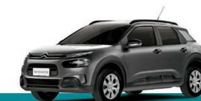
Versão LIVE 1.6 MECÂNICO

MOTOR 1.6 VTI DE 122 CV PROTETIVOS AIRBUMP® ASSINATURA LUMINOSA DE LED (DRL) LANTERNAS TRASEIRAS COM EFEITO 3D ISOFIX E TOP TETHER (FIXAÇÃO PARA CADEIRAS DE CRIANÇA) GSI - INDICADOR DE TROCA DE MARCHA TELA TOUCHSCREEN ESSENCIAL DE 5" COM COMANDO DE AR-CONDICIONADO INTEGRADO PAINEL DE INSTRUMENTOS 100% DIGITAL RODAS DE AÇO 16" COM CALOTAS TIPO "COMO" VIDROS ELÉTRICOS DIANTEIROS E TRASEIROS BARRAS DE TETO LONGITUDINAIS E INTEGRADAS AO TETO