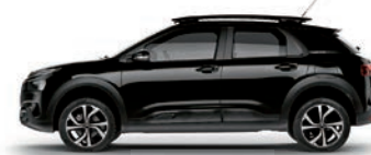
PRETO PERLA NERA

O SUV Citroën C4 Cactus inspira originalidade por conta do seu estilo bitom. A cor do teto define a cor do retrovisor, dos detalhes dos Airbumps® e da moldura do farol de neblina. No total, são diversas maneiras de impressionar você.