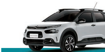
Versão SHINE 1.6 TURBO THP AUTOMÁTICO

ACESSO MÃOS LIVRES 4 AIRBAGS (DUPLO AIRBAG FRONTAL + AIRBAGS LATERAIS) RODAS DE LIGA LEVE 17" ROBY ONE DIAMANTADAS PRETO-BRILHANTE BARRAS DE TETO LONGITUDINAIS E FUNCIONAIS TIPO FLOTTANT VOLANTE REVESTIDO DE COURO BITOM SENSOR DE CHUVA E ACIONAMENTO AUTOMÁTICO DOS FARÓIS