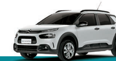
Versão FEEL 1.6 MECÂNICO

CITROËN CONNECT RADIO - CENTRAL MULTIMÍDIA TOUCHSCREEN DE 7" CONNECTIVIDADE COM ANDROID AUTO® E APPLE CARPLAY® CÂMERA DE RÉ CÂMBIO AUTOMÁTICO SEQUENCIAL DE 6 MARCHAS COM MODOS SPORT E ECO CONTROLE DE ESTABILIDADE (ESP) E ASSISTENTE DE PARTIDA EM RAMPA (HILL ASSIST) DETECTOR DE PRESSÃO DOS PNEUS