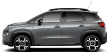
sivá PLATINUM (M)