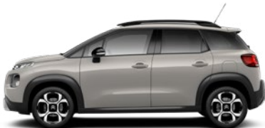
Béžová SABLE (M)