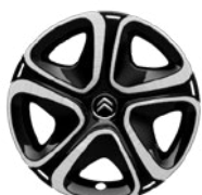
Okrasný kryt 3D 16"