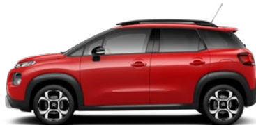
Červená PASSION (Z4P0)