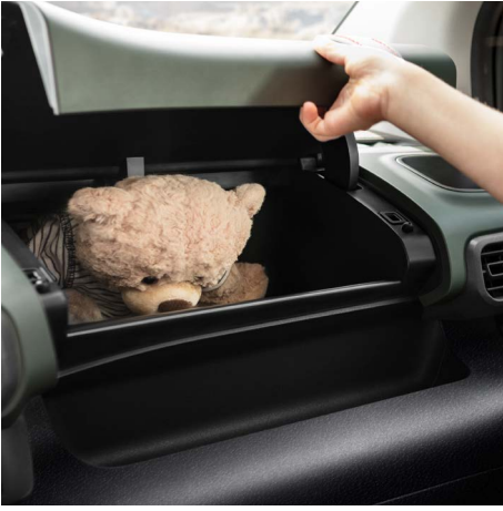
Top box torpido gözü