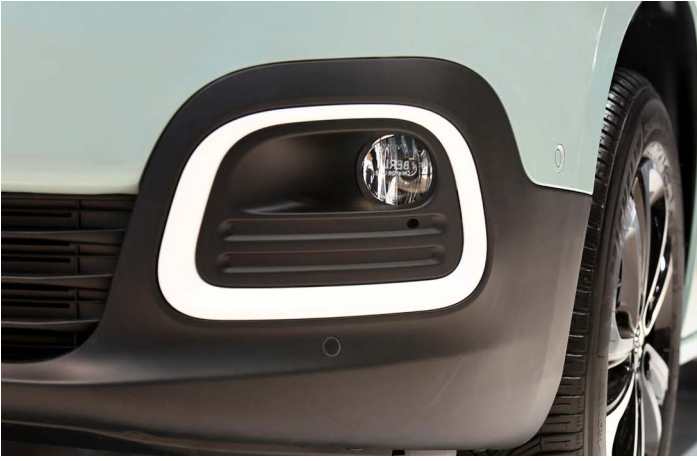
Çerçevesiz sis farları