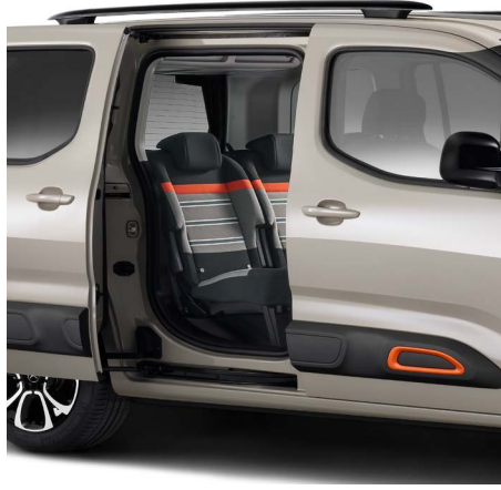
İki adet sürgülü yan kapı