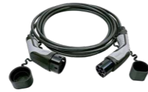
7,4 kW/32 A, 1-phasig, 6 m Teile-Nr.: 98 285 421 80

Diese Ladekabel benötigen Sie, um Ihr Fahrzeug an einer Wall Box oder einer öffentlichen Ladesäule zu laden.