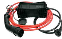
green'up 3,7 kW/14 A, Typ EF, 6 m Teile-Nr.: 98 358 568 80