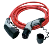
22 kW/32 A, 3-phasig, 6 m Teile-Nr.: 98 374 977 80