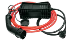
1,8 kW/8 A, Typ EF, 6 m Teile-Nr.: 98 237 808 80

Mit diesen Ladekabeln können Sie an jeder haushaltsüblichen Steckdose laden, mit der Variante „Green'Up“ sogar mit einer Leistung von bis zu 3,7 kW (eine entsprechende „Green'Up“-Steckdose vorausgesetzt).