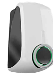
22 kW/32 A, 3-phasig, Smart Teile-Nr.: 98 356 626 80