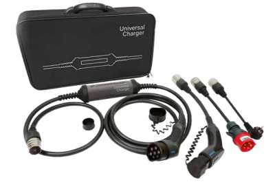
1,8–22 kW, inkl. Typ-2-Adapter, CEE16-Adapter, Typ-EF-Adapter und Transporttasche Teile-Nr.: 98 357 837 80

Mit diesem Set können Sie praktisch überall Ihre Batterie laden.