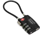
Sicherheitsschloss für Universal Charger