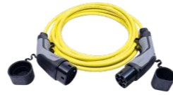
11 kW/16 A, 3-phasig, 6 m Teile-Nr.: 98 374 976 80