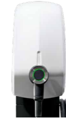
11 kW/16 A, 3-phasig, Kabel Teile-Nr.: 98 356 629 80